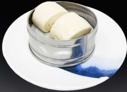
9. PAN AL VAPOR 3,95€ (2 und.)