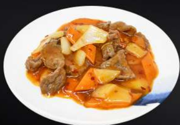
163. TERNERA PICANTE 7,20€ (ternera y verduras salteadas con salsa picante)