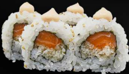
43. SAMURAI 4,20€ (arroz, alga, salmón, harina frito, mayonesa picante, sésamo) (4 und.)