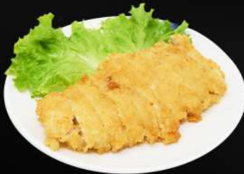
127. EMPANADA DE POLLO 6,50€ (pollo rebozado con pan rallado frito)