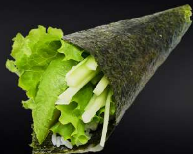
97. TEMAKI VEGETAL 3,80€ (arroz, lechuga, aguacate, pepino) (2. und.)