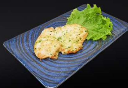
142. PECHUGA DE POLLO A LA PLANCHA 6,50€ (con salsa de ajo y perejil)