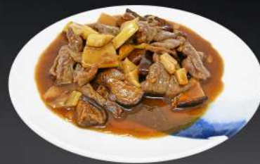
162. TERNERA CON BAMBÚ Y SETAS 7,80€ (ternera con bambú y setas chinas salteadas en salsa de soja)