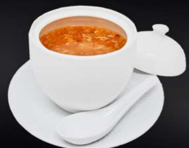
8. SOPA AGRIPICANTE 3,95€ (verduras, huevo, picante, vinagre)