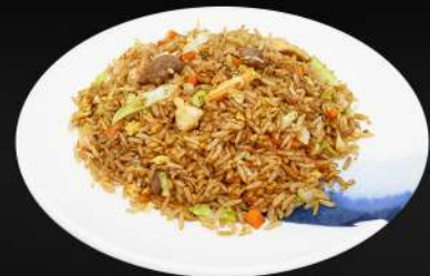
150. ARROZ MIXTO 5,80€ (arroz, huevo, pollo ternera, gamba, verduras, salsa de soja)