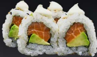
39. SALMÓN AGUACATE 4,20€ (arroz, alga, salmón, aguacate, mayonesa, sésamo) (4 und.)