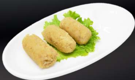
134. CROQUETAS DE POLLO 4,50€ (3 und.)