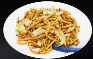
154. UDON 6,20€ (udon salteado con verduras y salsa de soja)