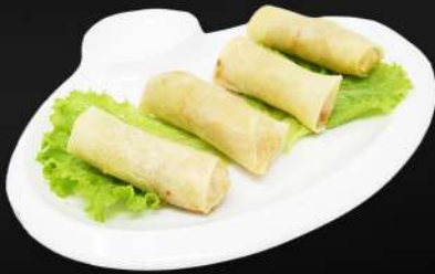
116. ROLLITOS DE PRIMAVERA 3,95€ (carne de cerdo, verduras) (4 und.)