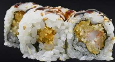
52. EBITEN 4,20€ (arroz, alga, gamba frita, salsa teriyaki, sésamo) (4 und.)