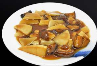
167. BAMBÚ Y SETAS 6,50€ (bambú y setas chinas salteadas con salsa de soja)