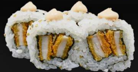
50. CALIFORNIA DE POLLO 4,20€ (arroz, alga, pollo frito, mayonesa picante, sésamo) (4 und.)