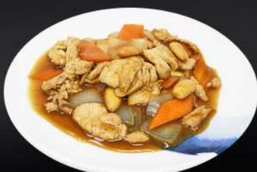
159. POLLO CON ALMENDRA 6,80€ (pollo y verduras salteadas con salsa de soja, almendras)