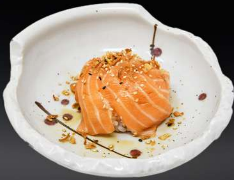
111. CHIRASHI DE SALMÓN 6,80€ (arroz, salmón, salsa especial, cebolla frita, sésamo)