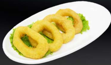
126. CALAMARES FRITOS 4,50€ (4 und.)