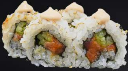
38. ATÚN PICANTE 4,20€ (arroz, alga, atún picante, pepino, mayonesa, sésamo) (4 und.)