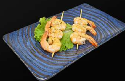
138. PINCHITOS DE GAMBA 3,50€ (con salsa de ajo y perejil) (2 pz)