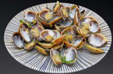
146. ALMEJAS A LA PLANCHA 6,20€ (con salsa de ajo y perejil) (3 platos limitado por persona)