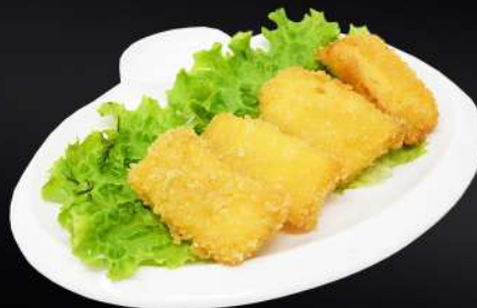
130. QUESO FRITO 4,80€ (queso rebozado con pan rallado frito) (4 und.)