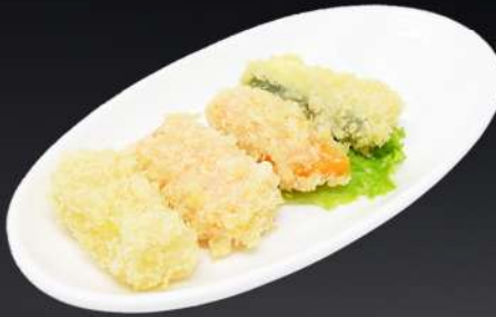
123. TEMPURA DE VERDURAS 4,50€ (4 und.)