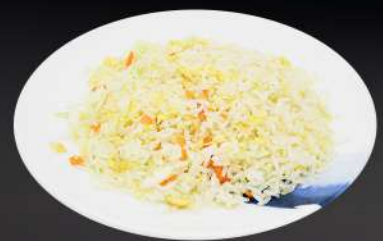
148. ARROZ CON VERDURAS 4,80€ (arroz, huevo, verduras)