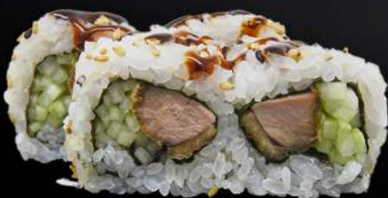
51. CALIFORNIA DE PATO 4,20€ (arroz, alga, pato frito, pepino, salsa teriyaki, sésamo) (4 und.)