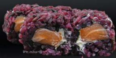
57. PHILADELPHIA VENUS 4,50€ (arroz negro, alga, salmón, crema de queso, salsa teriyaki, sésamo) (4 und.)