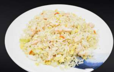
152. ARROZ CON GAMBA 5,20€ (arroz, huevo, gamba, verduras)