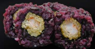
60. EBITEN VENUS 4,50€ (arroz negro, alga, gamba frita, salsa teriyaki, sésamo) (4 und.)