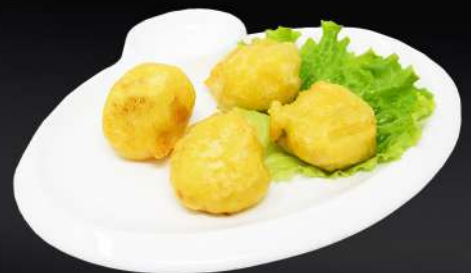
131. PLÁTANO FRITO 4,50€ (4 und.)