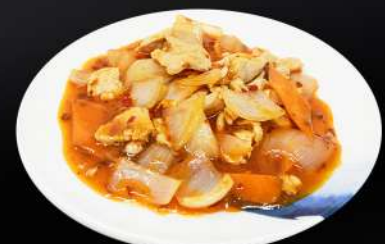
160. POLLO PICANTE 6,80€ (pollo y verdura salteadas en salsa picante)