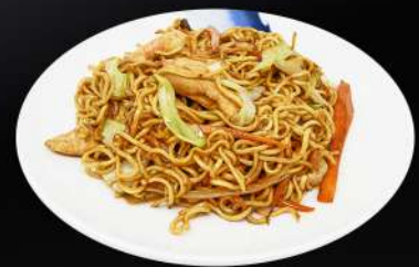
156. NOODLES MIXTO 6,80€ (tallarines, pollo, ternera, gamba, verduras, salsa de soja)