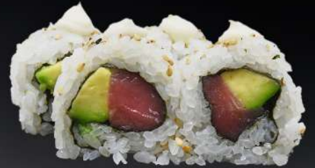
40. ATÚN AGUACATE 4,50€ (arroz, alga, atún, aguacate, mayonesa, sésamo) (4 und.)