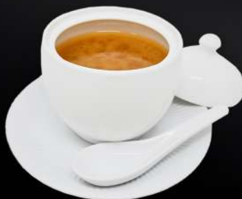
7. SOPA MISO 3,95€ (tofu, alga, miso)