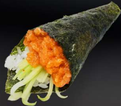
93. TEMAKI SALMÓN PICANTE 3,80€ (arroz, alga, salmón picante, pepino, mayonesa, sésamo) (1 und.)