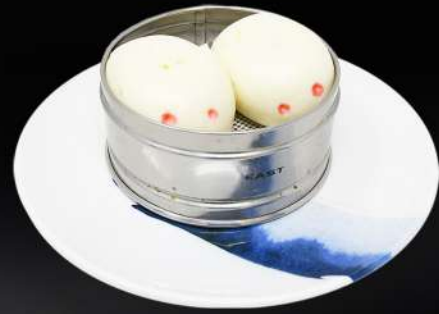
10. PAN CONEJITO 3,95€ (pan al vapor relleno con crema de huevo dulce) (2 und.)