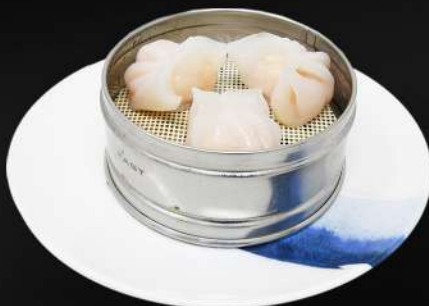
13. RAVIOLIS DE GAMBA 3,95€ (rellenos de gambas) (3 und.)