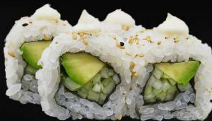
44. VEGETAL 4,20€ (arroz, alga, aguacate, pepino, mayonesa, sésamo) (4 und.)