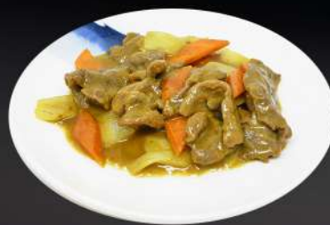
164. TERNERA CON CURRY 7,20€ (ternera y verduras salteadas con salsa curry)