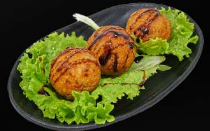
118. TAKOYAKI 3,95€ (bolas rellenas de pulpo con salsa teriyaki) (3 und.)