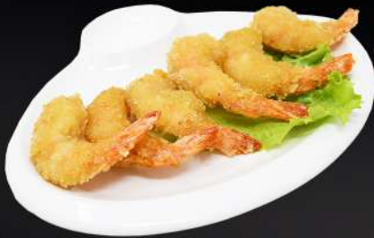
125. GAMBAS FRITAS 4,80€ (gambas rebozado con pan rallado frito) (6 und.)