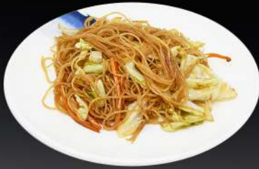
153. FIDEO DE ARROZ 6,20€ (fideo de arroz salteado con verduras y salsa de soja)