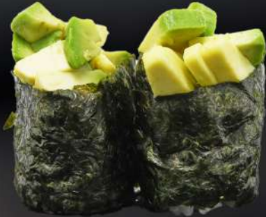
83. GUNKAN AGUACATE 3,20€ (arroz, alga, aguacate) (2 und.)