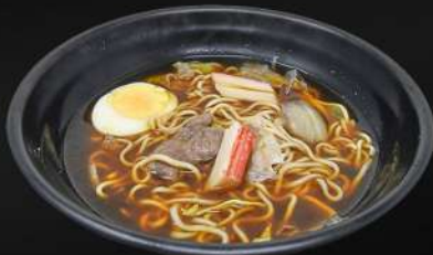
157. RAMEN DE TERNERA 7,20€ (ramen de sopa con tallarines, ternera, huevo, palito de cangrejo y verduras)