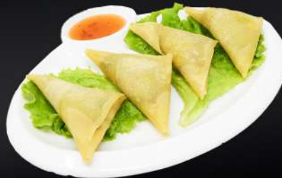
120. EMPANADILLA DE CURRY 3,95€ (empanadilla rellena de verduras y curry) (4 und.)