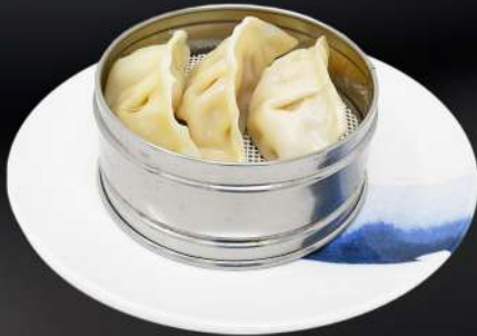
11. GYOZA AL VAPOR 3,95€ (gyoza relleno de cerdo) (3 und.)