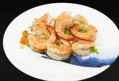
166. GAMBA CON SAL Y PIMIENTA 7,80€ (gambas fritas con sal y pimienta)