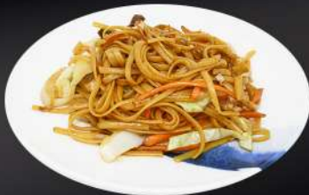
155. TALLARINES MIXTO 6,80€ (tallarines, pollo, ternera, gamba, verduras, salsa de soja)