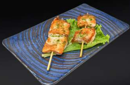
139. PINCHITOS DE SALMÓN 3,50€ (con salsa de ajo y perejil) (2 pz)