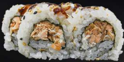
41. SALMÓN COCIDO 4,20€ (arroz, alga, salmón cocido, crema de queso, salsa teriyaki, sésamo) (4 und.)