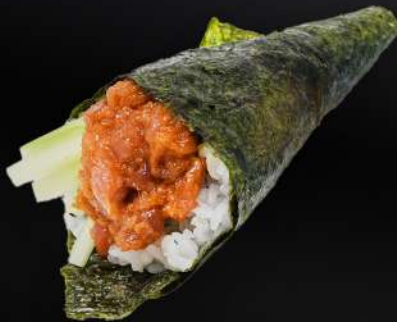
94. TEMAKI ATÚN PICANTE 3,80€ (arroz, alga, atún picante, pepino, mayonesa, sésamo) (1 und.)