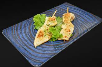
137. PINCHITO DE POLLO 3,50€ (con salsa de ajo y perejil) (2 pz)