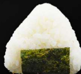
64. ONIGIRI SALMÓN COCIDO 3,50€ (arroz, alga, salmón cocido, crema de queso, salsa teriyaki, sésamo) (1 und.)