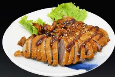
132. PATO FRITO 9,80€ (pato frito con salsa de pato y sésamo)