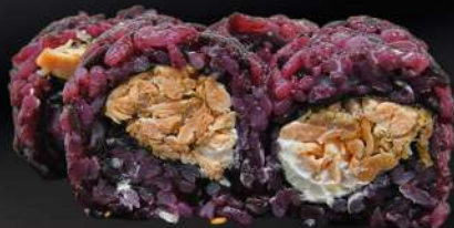
58. SALMÓN COCIDO VENUS 4,50€ (arroz negro, alga, salmón cocido, crema de queso, salsa teriyaki, sésamo) (4 und.)