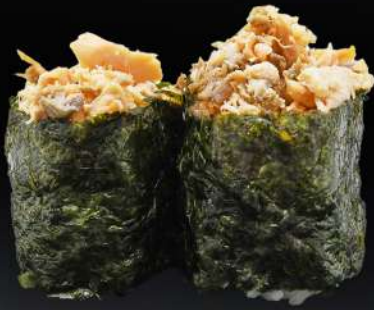
81. GUNKAN SALMÓN COCIDO 3,20€ (arroz, alga, salmón cocido) (2 und.)