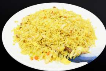
151. ARROZ CON CURRY 5,80€ (arroz, pollo, ternera, gamba, verduras, curry)