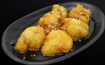
129. CERDO AGRIDULCE 4,80€ (bolitas de carne de cerdo frito con salsa agridulce y sésamo) (6 und.)