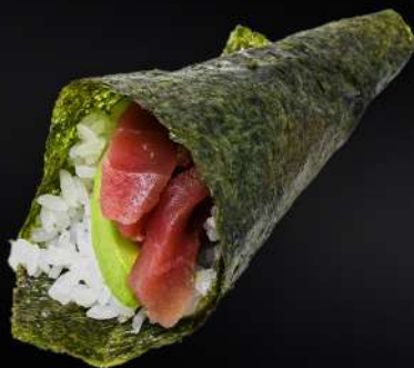
96. TEMAKI ATÚN AGUACATE 4,20€ (arroz, alga, atún, aguacate, mayonesa, sésamo) (1 und.)