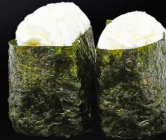
84. GUNKAN PHILADELPHIA 3,20€ (arroz, alga, crema de queso) (2 und.)