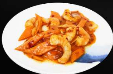
165. GAMBA PICANTE 7,80€ (gamba y verduras salteadas con salsa picante)