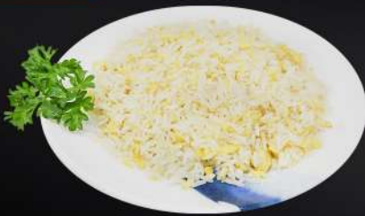
147. ARROZ CON HUEVO 4,50€ (arroz, huevo)