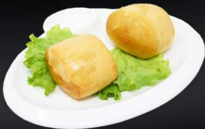
119. PAN FRITO 3,95€ (2 und.)