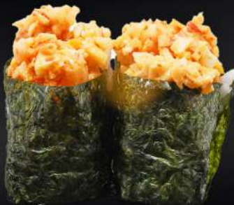
87. GUNKAN CANGREJO PICANTE 3,20€ (arroz, alga, cangrejo picante, mayonesa) (2 und.)