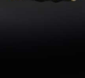
67. ONIGIRI SALMÓN VENUS 3,80€ (arroz negro, alga, salmón, mayonesa, sésamo) (1 und.)