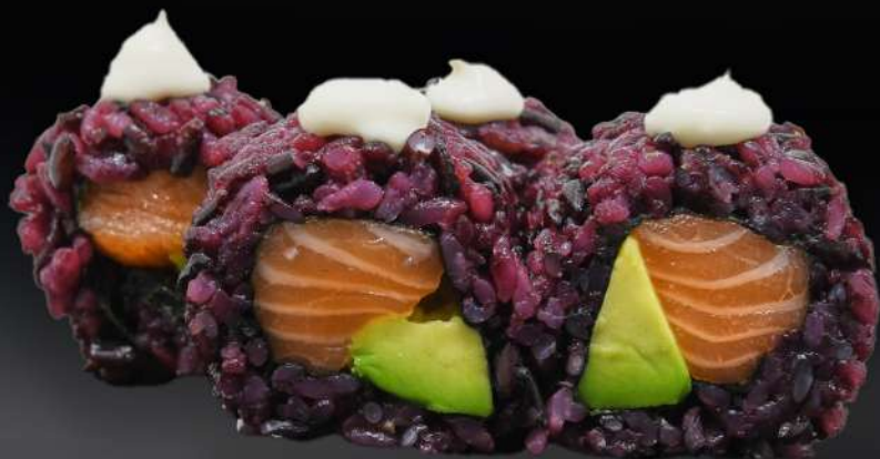
56. SALMÓN AGUACATE VENUS 4,50€ (arroz negro, alga, salmón, aguacate, mayonesa, sésamo) (4 und.)