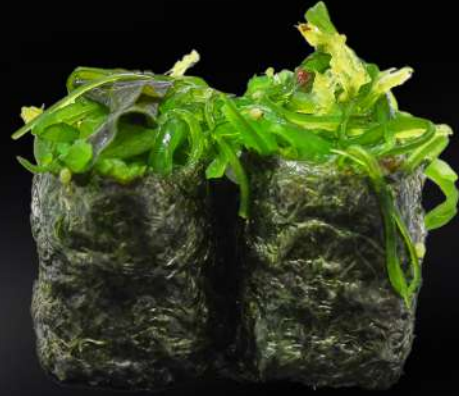
82. GUNKAN WAKAME 3,20€ (arroz, alga, ensalada de algas) (2 und.)