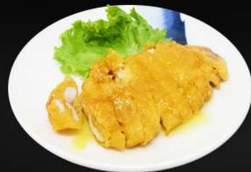
128. POLLO AL LIMÓN 6,80€ (pollo frito con salsa de limón)