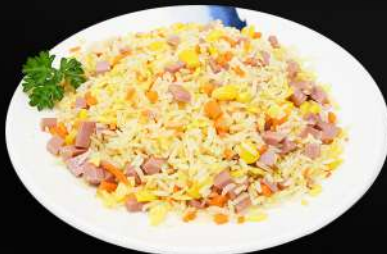
149. ARROZ TRES DELICIAS 5,20€ (arroz, huevo, jamón, maíz, verduras)