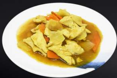
161. POLLO CON CURRY 6,80€ (pollo y verduras salteadas en salsa de curry)