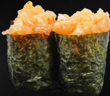
85. GUNKAN SALMÓN PICANTE 3,20€ (arroz, alga, salmón picante) (2 und.)