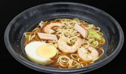
158. RAMEN DE GAMBA 7,20€ (ramen con sopa, tallarines, gamba, huevo, palito de cangrejo y verduras)