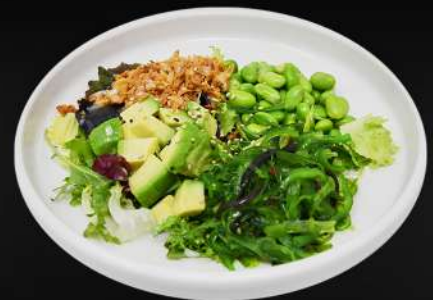
5. ENSALADA JAPONESA 5,20€ (aguacate, brotes, alga, judías, salsa de la casa)