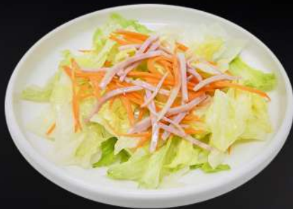
3. ENSALADA DE LA CASA 4,80€ (lechugas, zanahoria, jamón, salsa de la casa)