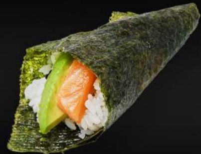
95. TEMAKI SALMÓN AGUACATE 3,80€ (arroz, alga, salmón, aguacate, mayonesa, sésamo) (1 und.)