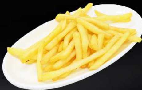
133. PATATAS FRITAS 4,50€