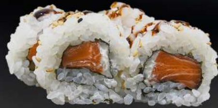
42. PHILADELPHIA 4,20€ (arroz, alga, salmón, crema de queso, salsa teriyaki, sésamo) (4 und.)