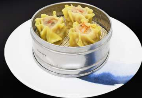
12. SHUMAI 3,95€ (shumai al vapor relleno de cerdo) (3 und.)