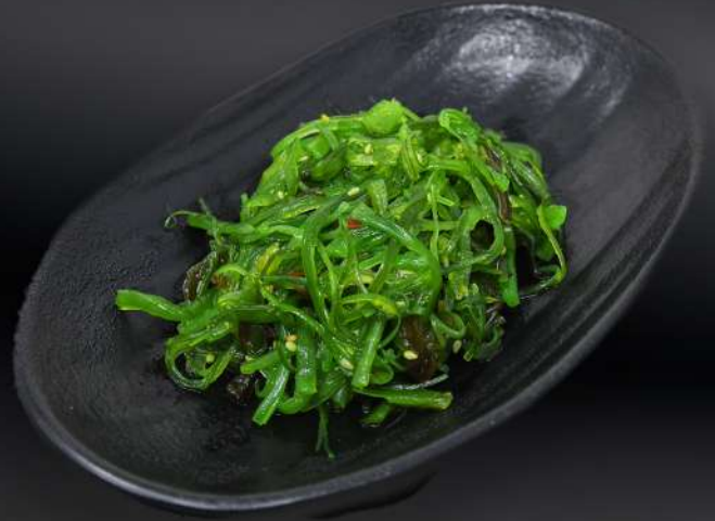
2. WAKAME 3,95€ (ensalada de algas)