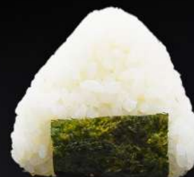
66. ONIGIRI ATÚN PICANTE 3,50€ (arroz, alga, atún picante, mayonesa, sésamo) (1 und.)