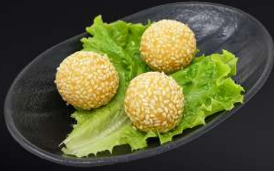
122. BOLAS DE SÉSAMO 3,95€ (bolitas de sésamo fritas relleno de judías rojas dulces) (3 und.)