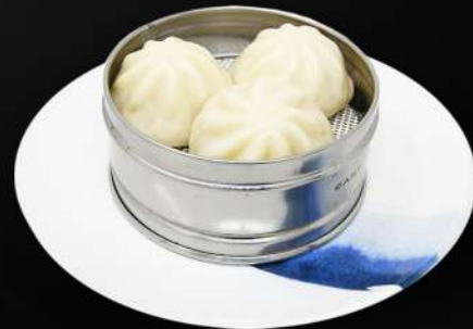
14. XIAO LONG BAO 3,95€ (rellenos de cerdo) (3 und.)