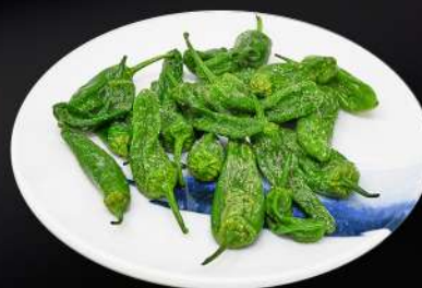
135. PIMIENTOS FRITOS 4,50€