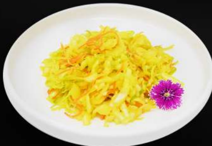
4. ENSALADA DE COL 4,80€ (col en vinagre, zanahorias)