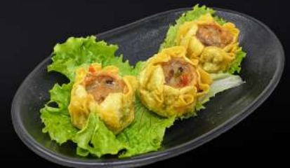
121. SHUMAI FRITO 3,95€ (shumai frito de cerdo) (3 und.)