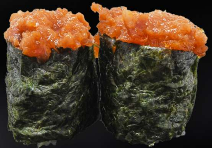
86. GUNKAN ATÚN PICANTE 3,80€ (arroz, alga, atún picante) (2 und.)