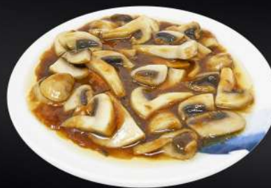
168. CHAMPIÑÓN CON SALSA DE OSTRA 6,50€ (champiñón salteado con salsa de soja y ostras)