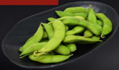
1. EDAMAME 3,95€